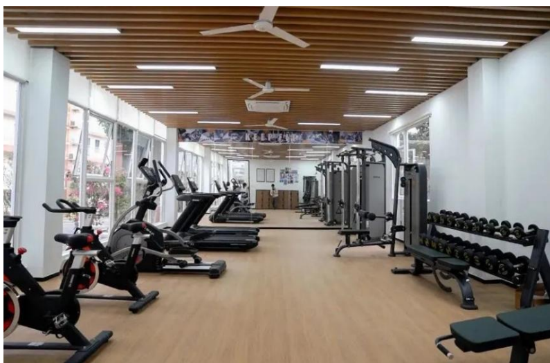
(图为 图文中心九楼教工健身房)