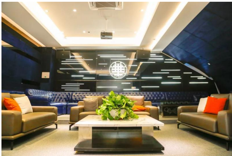
(图为 图文中心十楼教工之家)