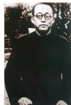
平民教育家陶行知