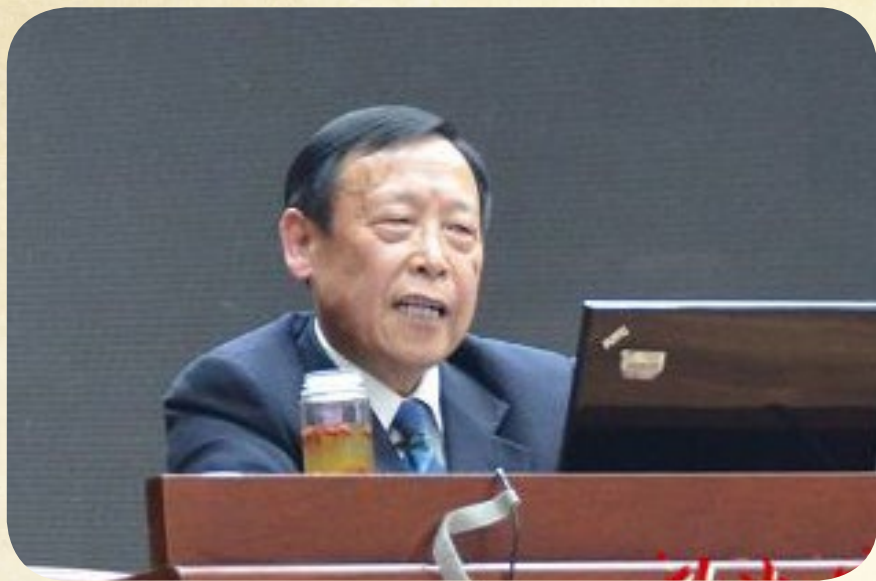
清华大学张学政教授